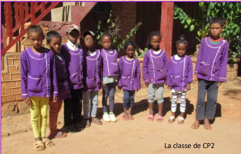
La classe de CP2