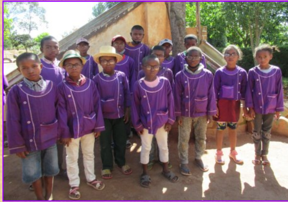
La classe des CM2