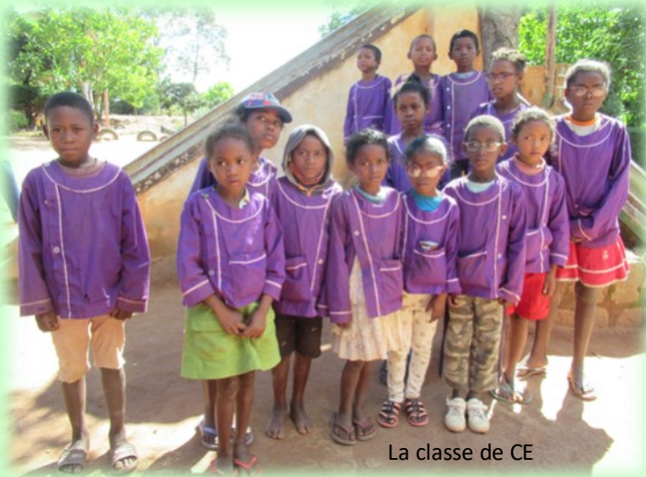
La classe de CE