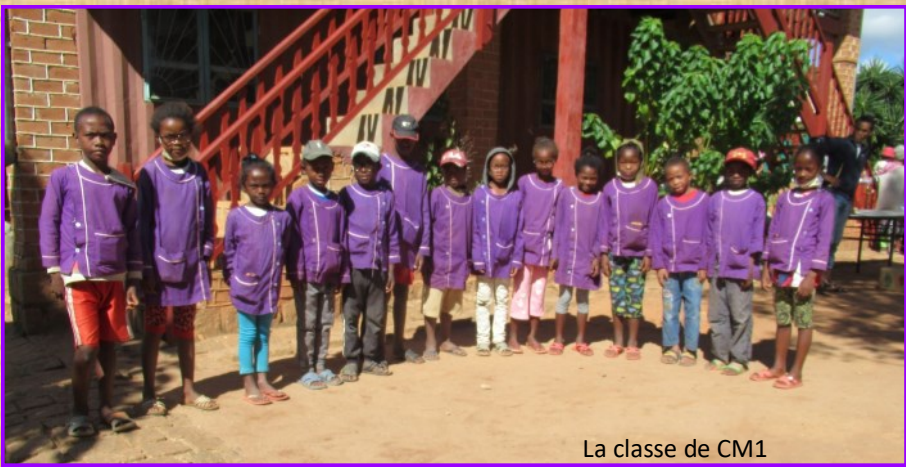
La classe de CM1