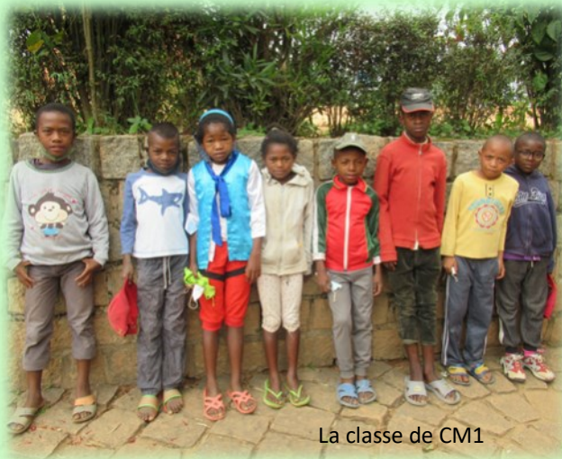
La classe de CM1

L'année est bien entamée. Voici enfin les photos des classes du primaire de l'école. Dans une même classe, il peut y avoir trois ans d'écart d'âge, selon la date du début de scolarisation. Cela explique des tailles variables ! Le 2 ème trimestre s'est achevé fin mars, avec pour toutes les classes des contrôles soutenus.