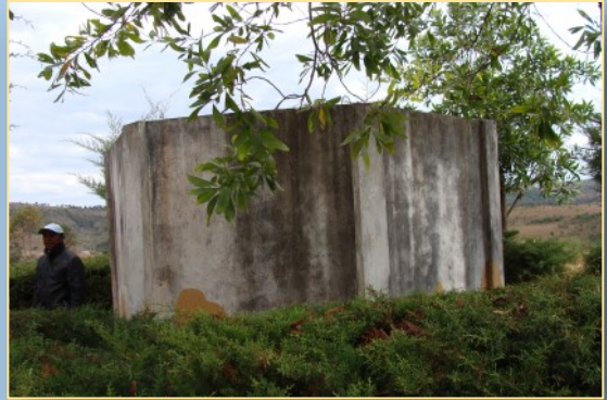
Le réservoir de 20m 3 (installé en 2011)