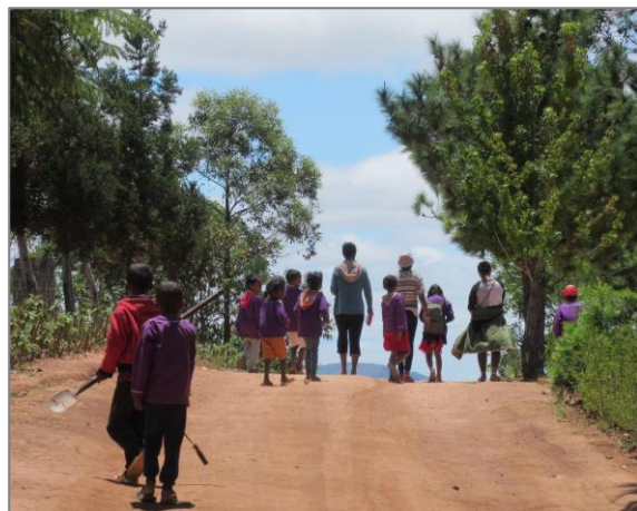
Départ des enfants à pied (mars 2020)

Plus d'informations et de photos sur www.lamaisondaina.org et sur le Facebook de LMA (mise à jour régulière).