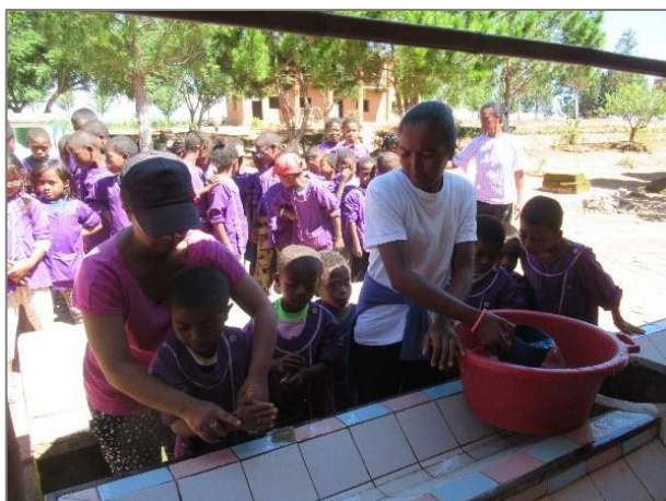
Lavage des mains avant le repas