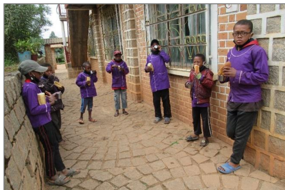
La classe de CM2 au travail et en pause goûter