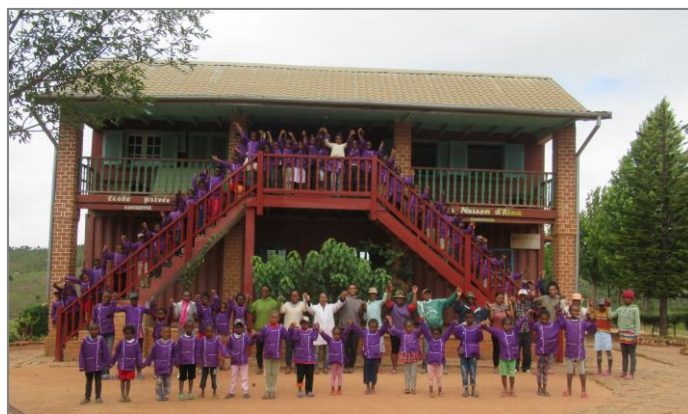
Les élèves de l'école, avant la fermeture