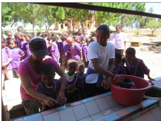
Lavage des mains avant le repas

Le Conseil d'Administration de LMA-France