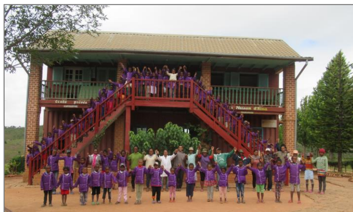
Les élèves de l'école, avant la fermeture